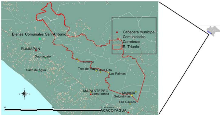
Figura 1. Localización de Bienes Comunales San Antonio, Pijijiapan, Chiapas, México.

BCSA se localiza en la cuenca alta y media de los ríos Pijijiapan y Urbina, al norte del municipio de Pijijiapan, región administrativa IX Istmo Costa, en la Sierra Madre de Chiapas vertiente del Océano Pacífico (Figura 1). Es un ambiente muy accidentado, dentro de un rango de 300 msnm en la parte sur a 2000 msnm en la parte norte. La colonización en esta zona data de principios del siglo XX por familias provenientes principalmente de los estados de Veracruz y Guerrero, quienes encontraron fuentes de empleo como obreros en la extracción de maderas preciosas.